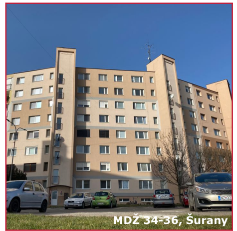
MDŽ 34-36, Šurany

V správe bytov máme dlhoročné skúsenosti, a preto vieme, že jednotlivé bytové domy vyžadujú osobitný prístup. Náš tím technikov a ekonómov na úseku Facility manažmentu svoju prácu neustále profesionalizuje a využíva dostupné moderné technológie pre zvyšovanie komfortu našich klientov.