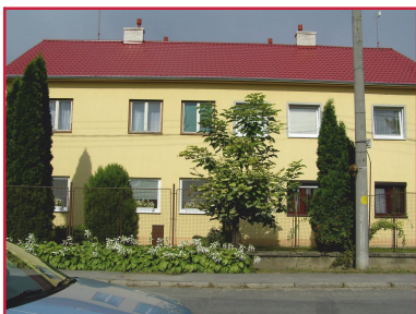
domy v našej správe